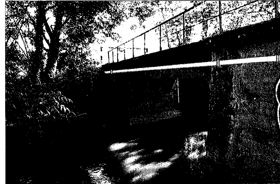
Corbeaux fixés au pont