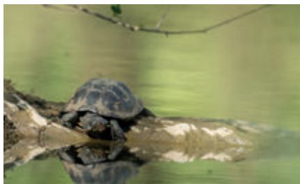
La Réserve Naturelle Régionale de l'Étang de Saint-Bonnet

Observation de nombreux oiseaux de l'étang toute l'année.