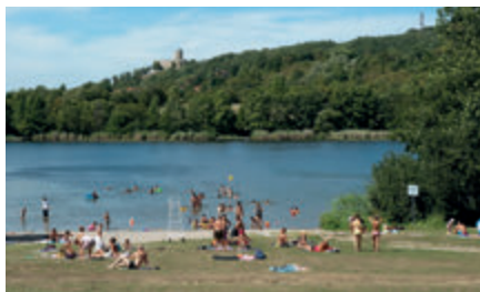
L' Espace Naturel Sensible de l'Étang de Fallavier et du Vallon du Layet

Communes de Saint-Quentin-Fallavier et Villefontaine