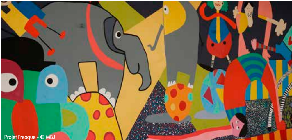
Projet Fresque - © MBJ

Cette matière a servi à l'artiste pour réaliser la maquette de la fresque . Elle est ensuite revenue à l'école pour une semaine complète de peinture avec les enfants, accompagnés de nombreux parents enthousiastes et motivés. Le projet s'est clos par un temps convivial de présentation, au cours duquel les invités ont pu découvrir l'œuvre qui égaye désormais la cour d'école, et tout le quartier !