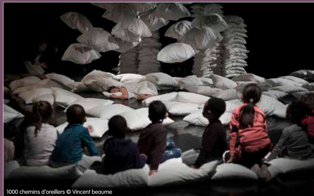
1000 chemins d'oreillers

Durant une semaine, guidés par les artistes de la Cie l'Insomnante, les élèves des 5 classes maternelles de la Peupleraie ont expérimenté tout un parcours fait d'oreillers, d'histoires et de musiques. En partant du thème de la nuit et du sommeil, ils ont été enregistrés pour recueillir leurs peurs et leurs doux rêves. Leurs voix ont ensuite été intégrées dans la bande son du spectacle. Ils ont également été invités avec leurs parents pour assister à une générale du spectacle.