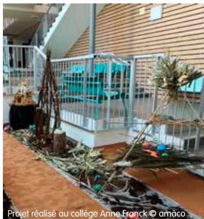
Projet réalisé au collège Anne Franck

L'école Les Fauvettes (L'Isle d'Abeau) et l'école des Éparres ont participé cette année au projet « Une nouvelle maison pour Martino » avec comme thématique l'habitat et les matières naturelles. L'objectif était de sensibiliser les enfants à leur environnement naturel et construit.