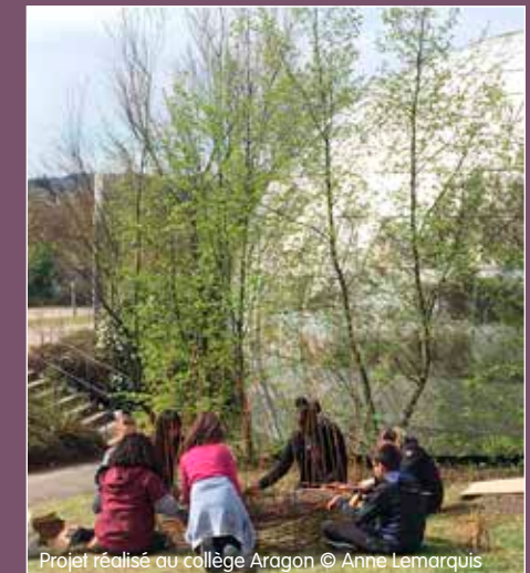
Projet réalisé au collège Aragon

Les élèves ont également exploré en dessinant différentes constructions imaginaires. Puis, sur le site attribué au sein du collège, ils ont esquissé les possibilités d'intervenir in situ avec des fibres végétales. L'enjeu a été de réaliser collectivement des installations dans le collège dans l'objectif de modifier le regard que nous portons sur ces espaces. La fissure d'un mur devient un élément du paysage, des personnages deviennent des géants menaçant un minuscule village, une terrasse de dalles devient un labyrinthe ou un parcours en forêt, les fenêtres des portes se changent en cadres mettant en valeur des "micro paysages..." ».