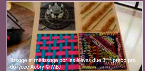
Tissage et métissage par les élèves de la 3 e prépa pro du lycée Aubry

Le volet artistique du projet a été mené en collaboration avec l'artiste-plasticienne Maud BONNET, qui utilise le textile comme medium artistique. Celle-ci est intervenue auprès des élèves pour la réalisation d'œuvres autour de la thématique « Tissage-Métissage ». Celles-ci ont ensuite été exposées au Lycée, ainsi qu'à l'exposition de restitution des projets PLEA du musée.