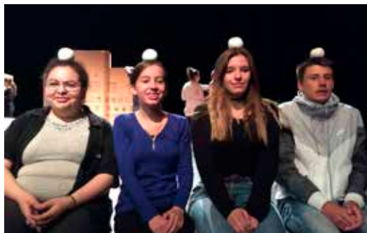
Projet « C'est quoi ce cirque ? »