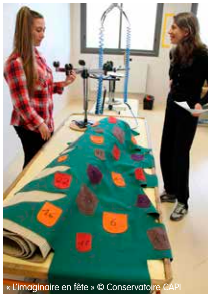
« L'imaginaire en fête »

Ce projet a été mené auprès d'une classe de 1 ère tapisserie d'ameublement et une 1 ère Chaudronnerie.